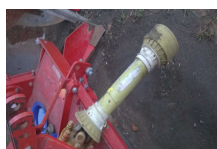
WP_20160202_004.jpg 336 KB