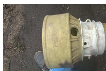
WP_20160202_005.jpg 541 KB