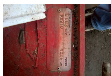
WP_20160205_001.jpg 427 KB