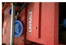
WP_20160202_001.jpg 335 KB

Coordenação do Eixo Tecnológico Recursos Naturais