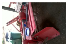
WP_20160202_002.jpg 315 KB