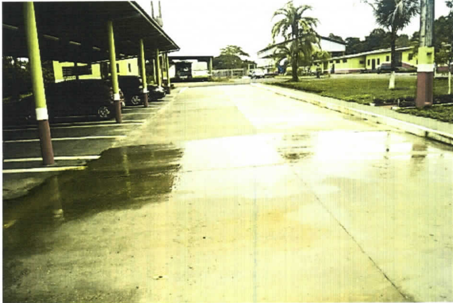
Infiltração no piso do Estacionamento