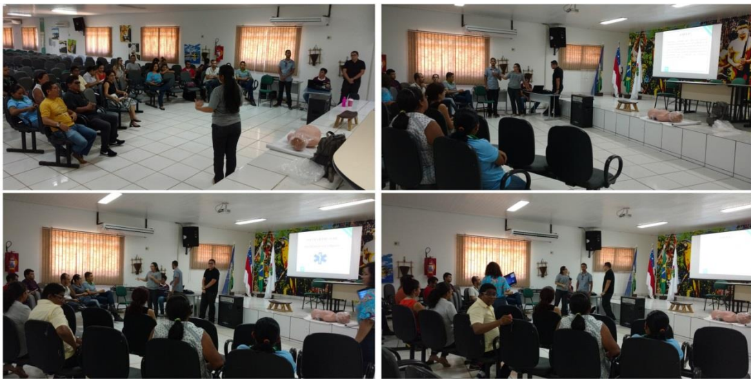
Noções Básicas de Primeiros Socorros (Servidores), Março 2018.