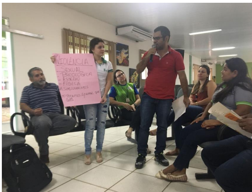
Campanha de “Enfrentamento ao Abuso e Violência sexual contra crianças e adolescentes”, maio 2018