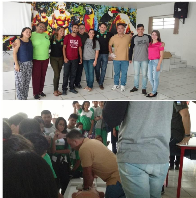
Noções Básicas de Primeiros Socorros (Discentes), Fev 2018.