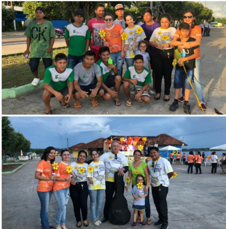
Campanha de “combate ao abuso e à exploração sexual de crianças e adolescentes na Orla da Praia”, maio 2018.