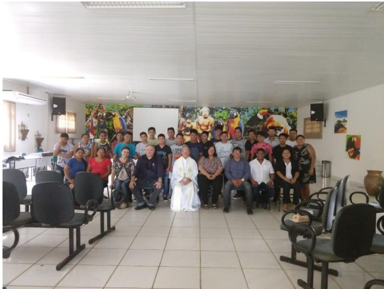
Missa destinada aos residentes, abril 2018