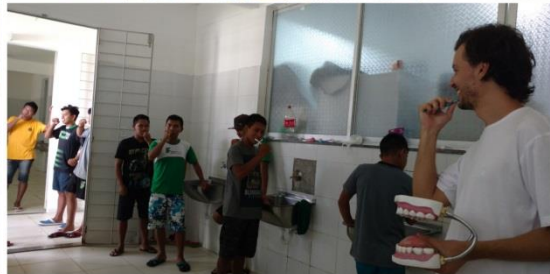
Orientação Saúde Bucal destinada aos residentes, fev 2018.