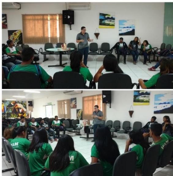
Sexualidade e gravidez na adolescência, Março 2018.