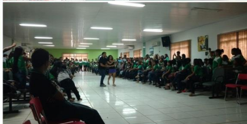
Dia Internacional da Mulher, Março 2018.