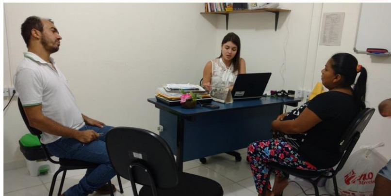
Visita domiciliar e atendimento multiprofissional, fev 2018.