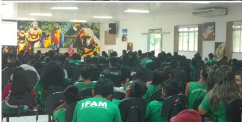
Palestra sobre Malária destinada aos discentes, maio 2018.