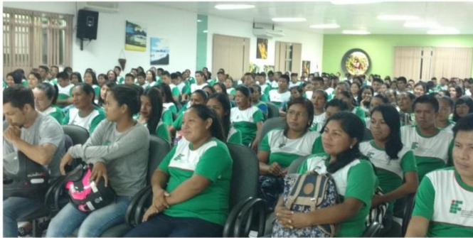
Palestra Malária, Março 2018.