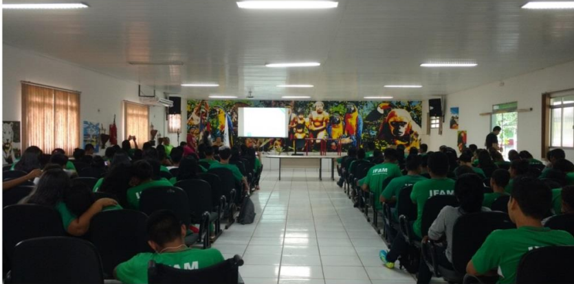
Noções Básicas de Primeiros Socorros (Discentes), Fev 2018.