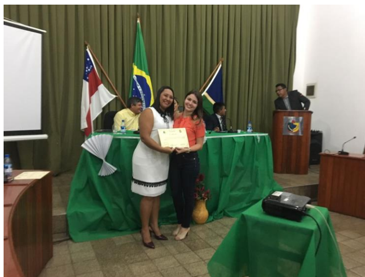
Homenagem à enfermagem na câmara de vereadores, maio 2018.