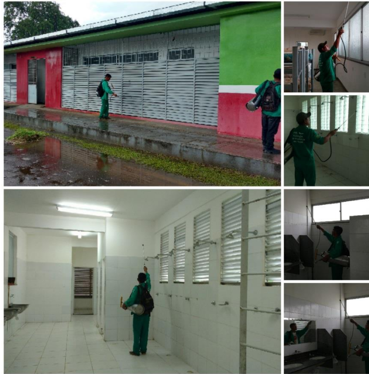
Ação de Bloqueio da Malária, Fev 2018.