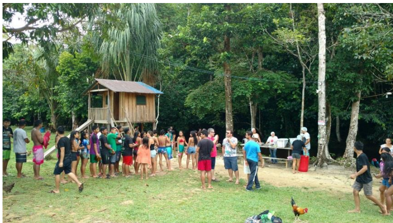
Apoio à premiação dos Jogos Internos, Abril 2018