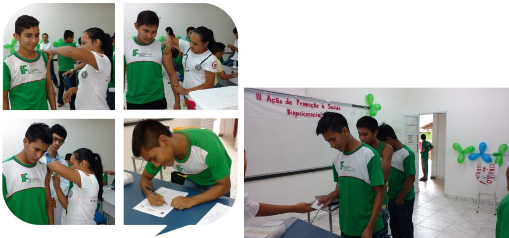
Vacinação contra Influenza destinada aos residentes, maio 2018.