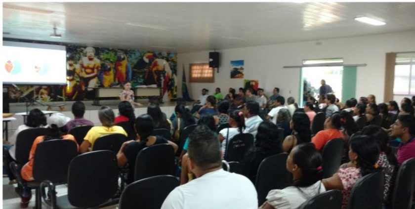
Palestra sobre Malária destinada aos pais e servidores, maio 2018.