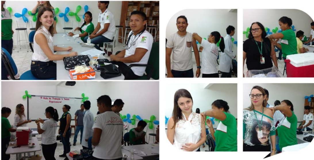
Vacinação contra Influenza destinada aos servidores, Maio 2018