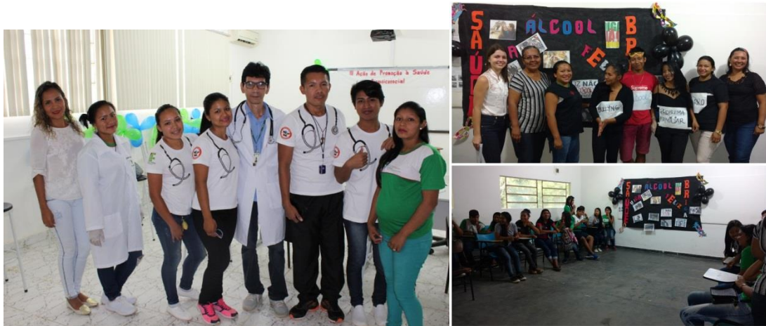
III ação de promoção à saúde Biopsicossocial, Maio 2018.