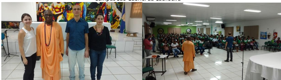
Participação da palestra “A saúde do corpo e da mente”, maio 2018.