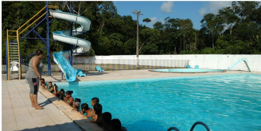
Suporte de saúde em aula prática Natação, fev 2018.