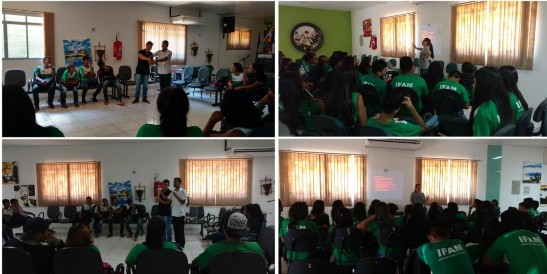
Sexualidade e gravidez na adolescência, Março 2018.