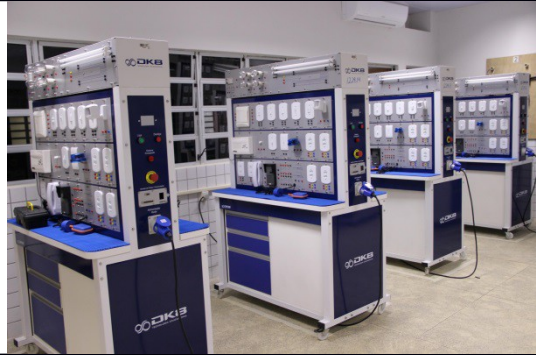
Exemplos de Fotos de Salas de Aula